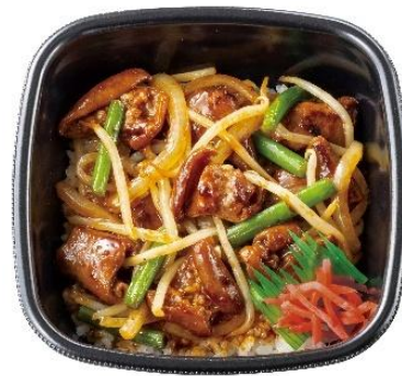
3 種味噌の特製だれ 牛もつ味噌焼き重(丼タイプ) 690 円

※1 日あたりの野菜摂取量の目標 350g 以上(厚生労働省「健康日本 21」<第 3 次>より)