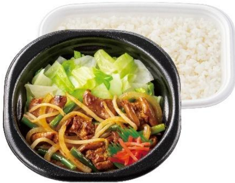
3 種味噌の特製だれ 牛もつ味噌焼き弁当(鍋タイプ) 790 円