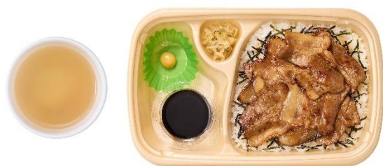
[テイクアウト] ～三元豚使用～豚まぶし だし付 1,070 円