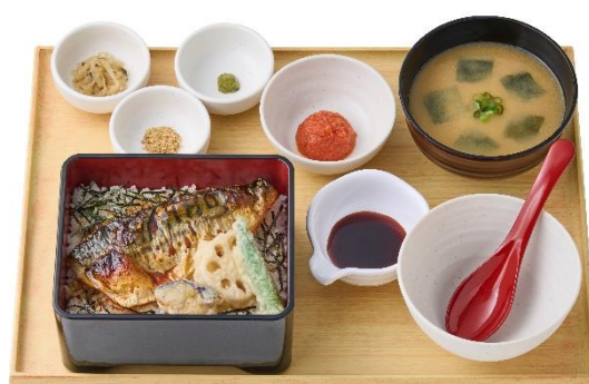
～骨取りサバ使用～ 【明太子付】焼サバと天ぷらのまぶし定食 1,260 円