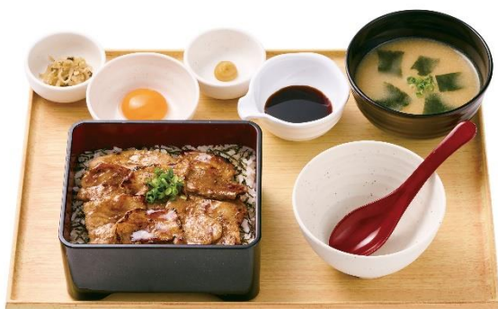
～三元豚使用～豚まぶし定食 1,140 円