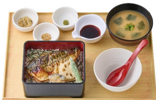
～骨取りサバ使用～ 焼サバと天ぷらのまぶし定食 1,140 円