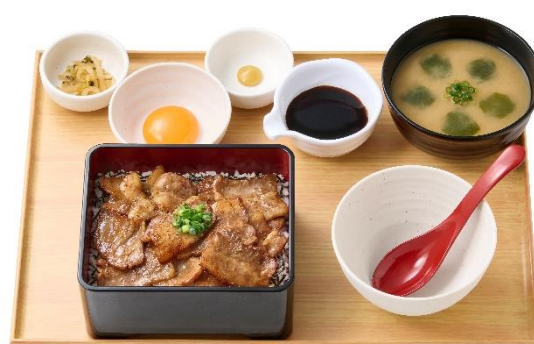
～三元豚使用～【お肉2倍】豚まぶし定食 1,690 円