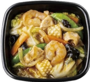
エビ・イカ入り！ 海鮮中華あんかけごはん 840 円