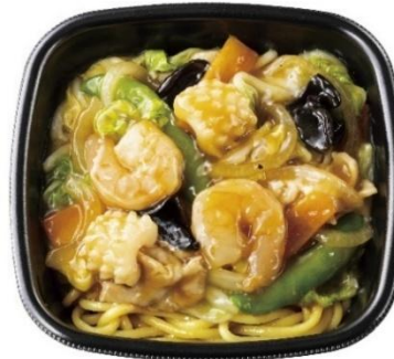
こだわりのもちもち麺 海鮮中華あんかけ麺 840 円

※1日あたりの野菜摂取量の目標 350g 以上(厚生労働省「健康日本 21」＜第3次＞より)