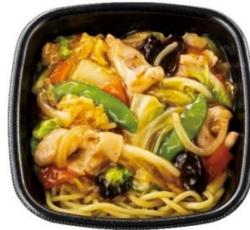
こだわりのもちもち麺 中華あんかけ麺 670 円