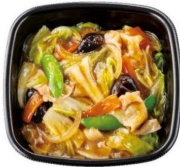
野菜たっぷり 中華あんかけごはん 670 円