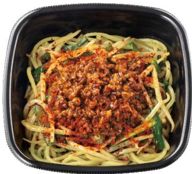
辛さがやみつき 辛旨台湾まぜ麺 650 円 ※温玉付き：750 円