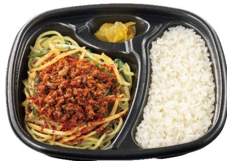
追い飯で最後まで楽しめる！ 辛旨台湾まぜ麺弁当 790 円 ※温玉付き：890 円