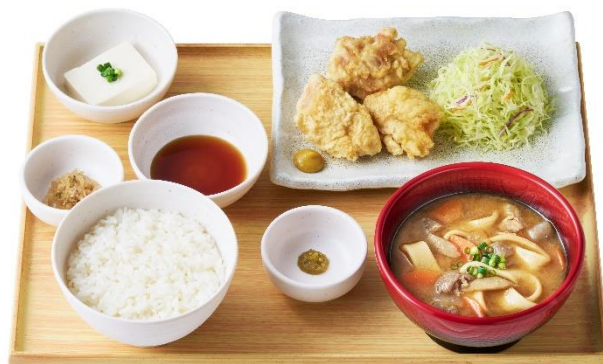
大分とり天とだんご汁の定食 1,190 円