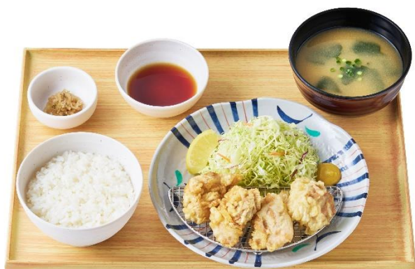
大分とり天定食 960 円