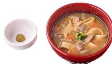
だんご汁(単品) 470 円 / だんご汁変更 370 円