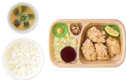
[テイクアウト] 大分とり天 ごはん・みそ汁付 960 円