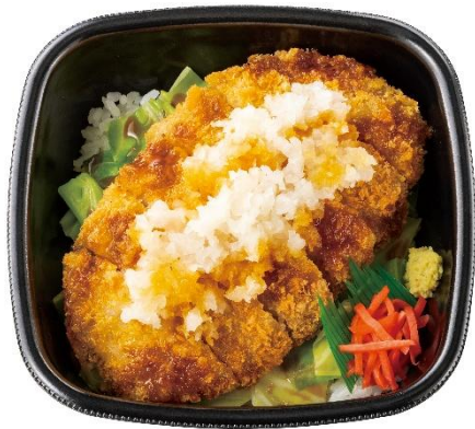
焼津産鯉節だし使用 おろしかつめし(丼タイプ) 690円