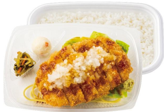
焼津産鯉節だし使用 おろしかつ弁当 750円