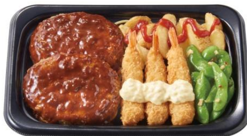
グリルハンバーグ(デミ)&エビフライプレート 1,300 円