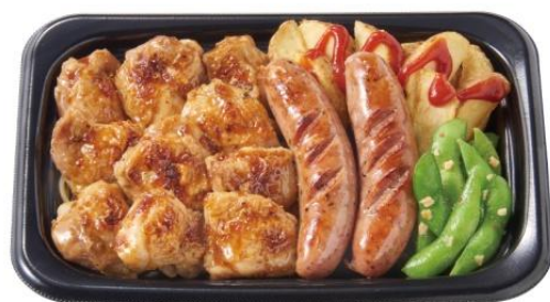
和風グリルチキン&あらびきソーセージプレート 1,300 円