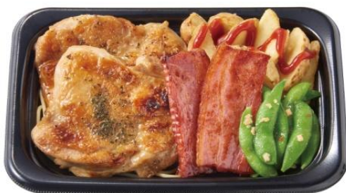
ワイルドチキン(塩)&厚切りベーコンプレート 1,300 円