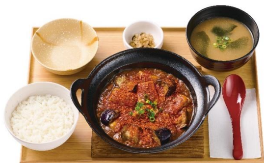
～四川風～ 辛旨・麻婆茄子豆腐定食 1,210 円