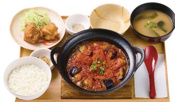
【から揚げ小鉢付】 ～四川風～辛旨・麻婆茄子豆腐定食 1,470 円