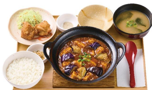
【から揚げ小鉢付】 ～四川風～麻婆茄子豆腐定食 1,400 円