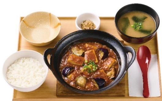
～四川風～ 麻婆茄子豆腐定食 1,140 円