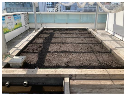
茅場町あおぞら田んぼ