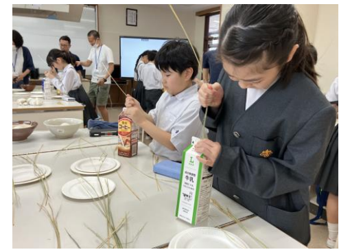
10月 脱穀・粳摺・精米