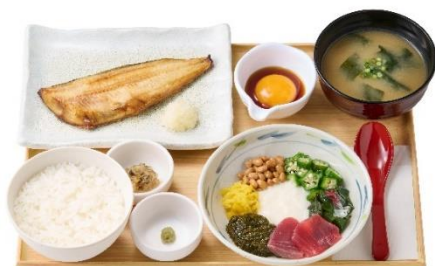
～8種の彩り～ アカモクねばとろとしまほっけの定食 1,290円 / 【明太子付】 1,410円