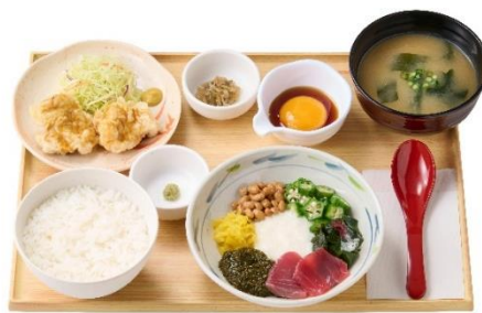
～8種の彩り～ アカモクねばとろとり天の定食 1,190円 / 【明太子付】 1,310円