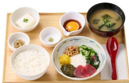
～8種の彩り～ アカモクねばとろ定食 990円 / 【明太子付】 1,110円