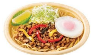
もちもち麺と相性抜群！ ガパオまぜ麺 690円