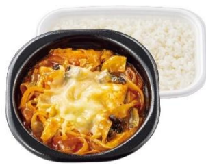
まろやかチーズ×痺れる辛さ チーズ麻辣湯弁当 830円