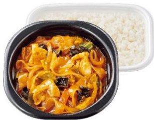
痺れる辛さ 麻辣湯弁当 730円