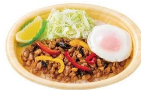
気軽に本格タイ料理 ガパオライス 690円