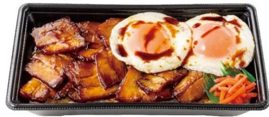
～今治焼豚玉子飯世界普及委員会監修～ W 今治焼豚玉子飯(肉 2 倍) 950 円