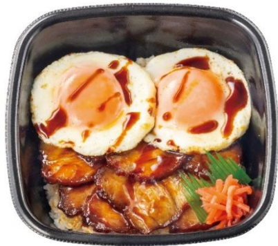
～今治焼豚玉子飯世界普及委員会監修～ 今治焼豚玉子飯 690 円