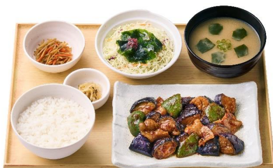
なす味噌ランチ 990円