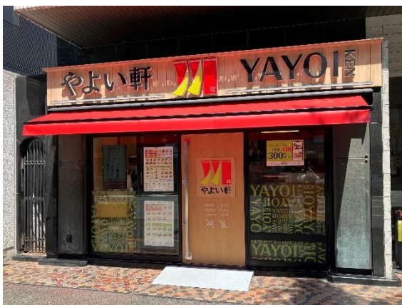
「やよい軒 筑紫口店」外観