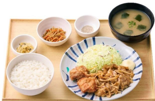
しょうが焼ランチ 990円

11時～17時限定で、ランチメニューをご用意しております。「から揚げ」付きや「サラダ」付きのほか、ランチタイムならではの組み合わせもお楽しみいただけます。