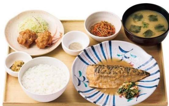
サバの味噌煮ランチ 1,070円