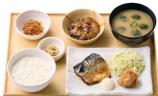
サバの塩焼とミニすき焼きランチ 1,040円