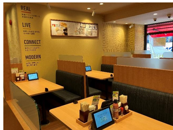
「やよい軒 筑紫口店」内観