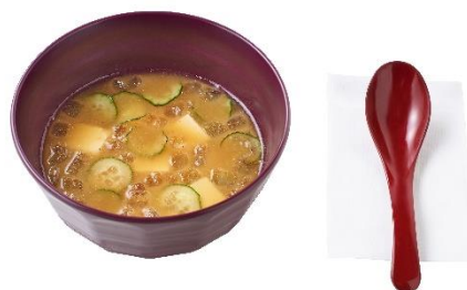
宮崎冷汁(単品) 290 円 宮崎冷汁変更 190 円