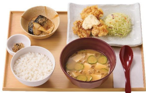
宮崎冷汁ととり南蛮の定食 1,150 円