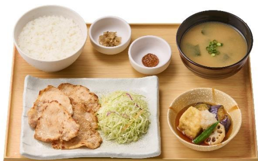
三元豚ロースの西京焼と揚げ出し豆腐の定食 1,120 円