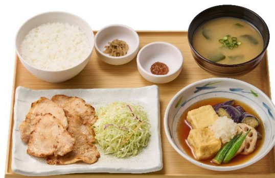
【揚げ出し豆腐 2 倍】 三元豚ロースの西京焼と揚げ出し豆腐の定食 1,320 円