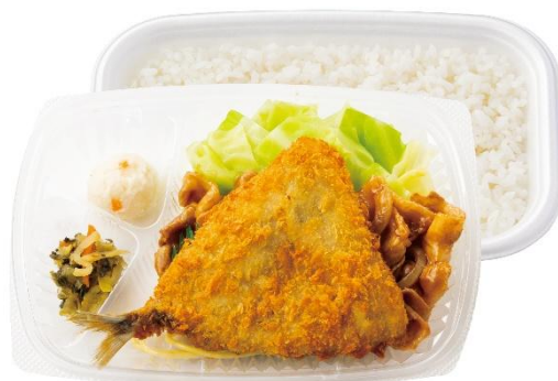
おかずたっぷり アジフライ&しょうが焼き弁当 670円～