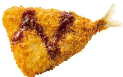
単品惣菜 アジフライ 180円