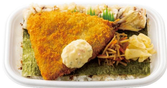
アジフライ×のり弁当 アジフライのりタル弁当 550円～