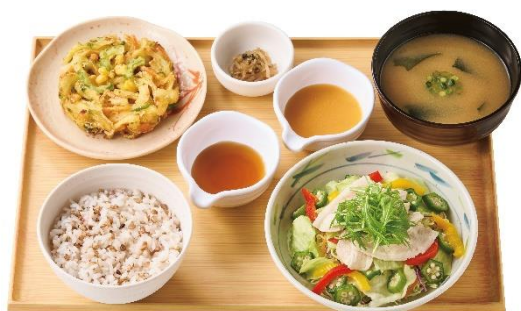
夏越ごはん と 豚しゃぶの定食 1,090 円