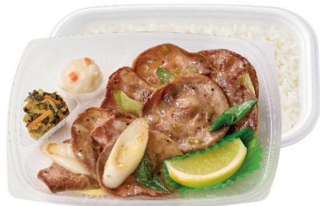
さっぱりなのに大満足 ねぎ塩レモン豚タン弁当 920 円