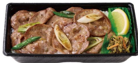
さっぱりなのに大満足 ねぎ塩レモン豚タン重 890 円