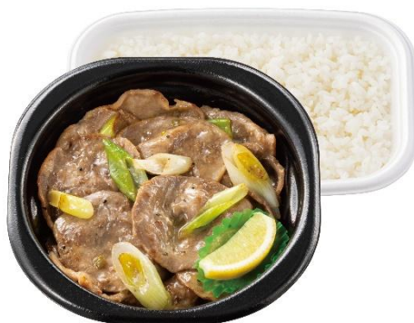
さっぱりなのに大満足 倍盛ねぎ塩レモン豚タン弁当(肉2倍) 1,490 円