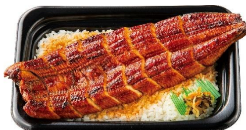
【WEB限定】 1本うな重 2,590円