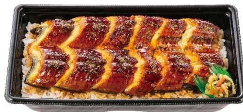
特製だれで味わう 上・うな重(6切れ) 1,800円