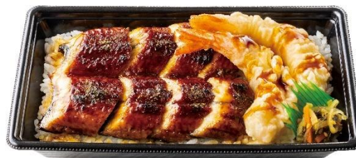
大きな海老と楽しむ 大海老天うな重(4切れ) 1,540円