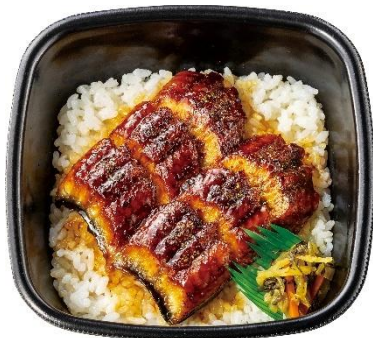
特製だれで味わう うな重(3切れ) 1,040円