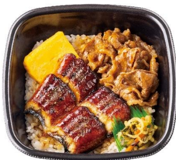
甘辛牛肉と楽しむ 牛すきうな重(2切れ) 940円