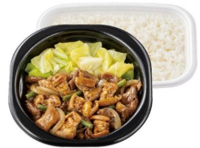
スタミナ満点！ 倍盛牛カルビ&ホルモン弁当 (肉2倍) 1,450円