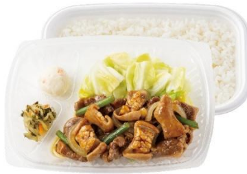
スタミナ満点！ 牛カルビ&ホルモン弁当 890円