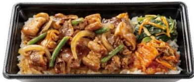
スタミナ満点！ 牛カルビ&ホルモン重 860円