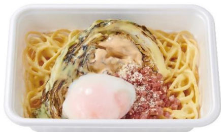
月見焼きカルボナーラ 550円 (焼きカルボナーラ 480円)

赤味噌風味の甘い味噌だれがとんかつとごはんをしっかり染みていて、温玉と食べるとマイルドな味わいになります。温玉なしもごさいます。