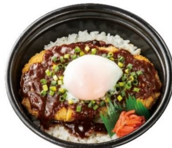
月見ねぎ味噌かつ丼 590円 (ねぎ味噌かつ丼 520円)

オープンで焼いた、鶏ももの一枚肉と長葱を焼鳥のたれで味付けました。とろりとした温玉で味に深みが増します。温玉なしもごさいます。