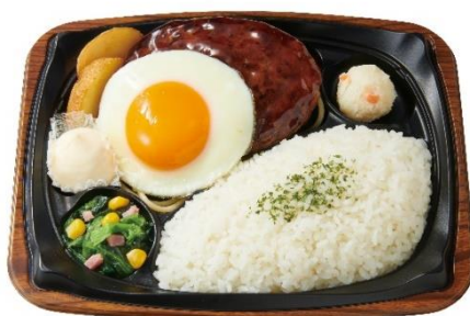
てりたまグリルハンバーグプレート 650円

ソースかつと目玉焼きや、マヨネーズの組み合わせは、ごはんが進みます。グリーンリーフと赤・黄ピーマンのサラダも一緒にお召上がりください。