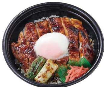
月見大判焼鳥丼 650円 (大判焼鳥丼 580円)

オープンで焼いた、鶏ももの一枚肉と長葱を焼鳥のたれで味付けました。とろりとした温玉で味に深みが増します。温玉なしもごさいます。