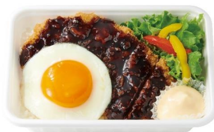
月見ソースかつBOX 560円

チーズと温玉が絡んだカルボナーラはクリーミーな味わい。オープンで焼いたスパゲティの食感がアクセントです。温玉なしもごさいます。