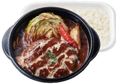
グリルハンバーグのデミソース煮込み 950 円 (おかずのみ) 850 円