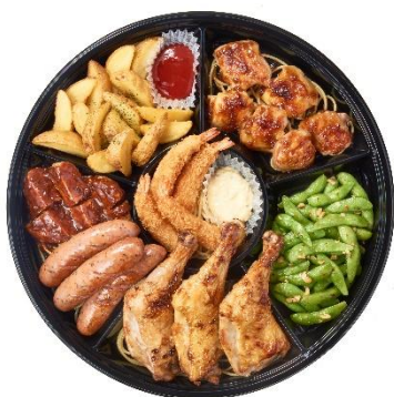
グリルオードブル 3,000円

1本からご購入いただける『チキンレッグ』は、骨付きの大きな鶏もも肉にハーブソルトをかけて、店内のオーブンで焼き上げることで、肉汁と旨味を閉じ込め、外はこんがり、中はジューシーに仕上げました。さらに、12月1日(水)より31日(金)までの期間限定で、『チキンレッグ』3本と『フライドポテト』を一緒に楽しめるお得な『チキンレッグ&ポテトプレート』も販売いたします。