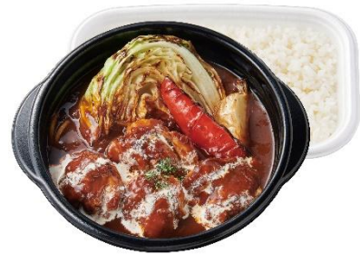
グリルチキンのデミソース煮込み 850 円 (おかずのみ) 750 円