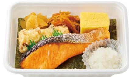
しゃけの塩焼き B O X 530 円