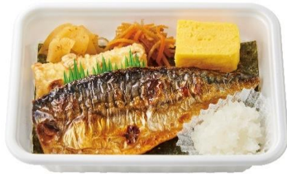
さばの塩焼き B O X 530 円