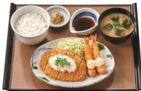
和風おろしロースとんかつとエビフライの定食 890 円