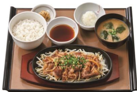
和風おろし焼肉定食 790 円