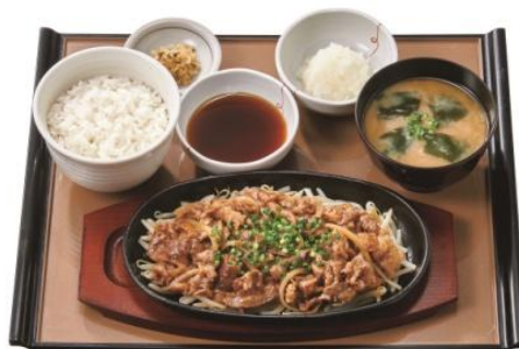
特和風おろし焼肉定食 1,090 円