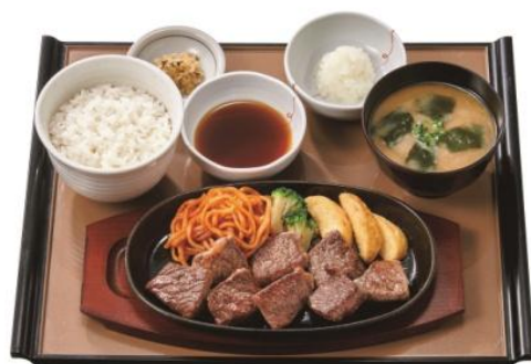
和風おろしカットステーキ定食 1,000 円