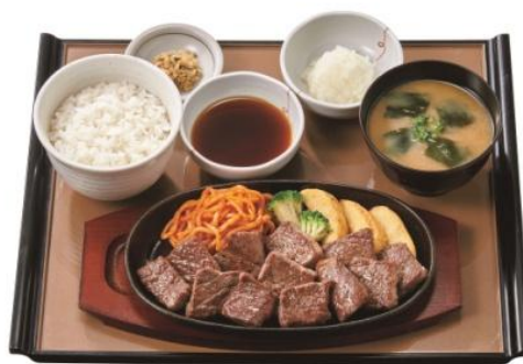
特和風おろしカットステーキ定食 1,520 円