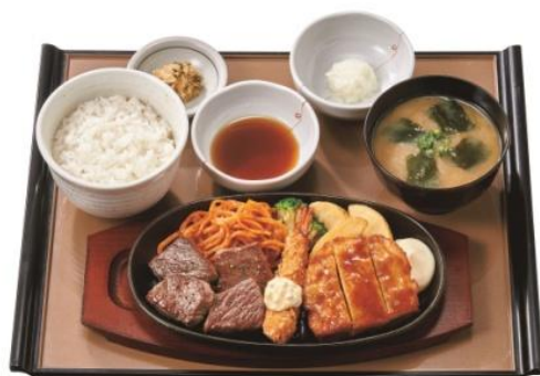
和風おろしカットステーキミックス定食 1,000 円