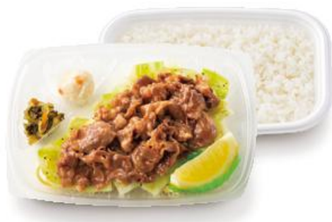
～キャベツたっぷり～ ビーフレモン弁当 600 円

より肉をがっつり味わいたい方には、通常の 2 倍の肉を使用した『～キャベツたっぷり～W ビーフレモン弁当』もご用意しております。ごはんと一緒に思い切り肉をかき込んでお召し上がりください。