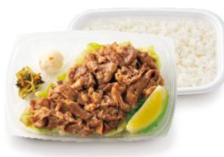
～キャベツたっぷり～ W ビーフレモン弁当 900 円