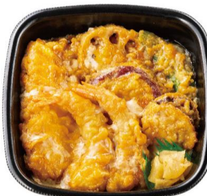
海鮮天とじ丼 640 円