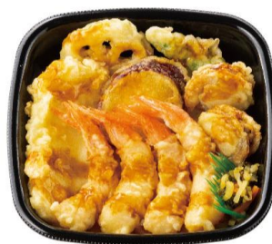
上・海鮮天丼 760 円