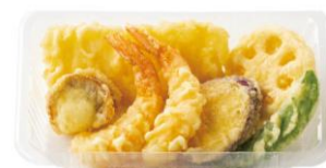
天ぷら盛り合わせ 490 円