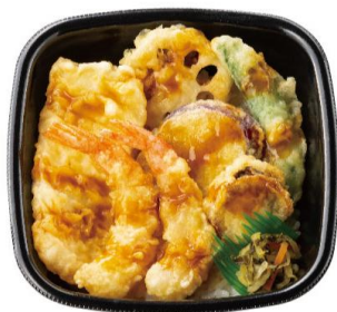
海鮮天丼 590 円

さらに、『海鮮天丼』の天ぷらのみをお持ち帰りいただける『天ぷら盛り合わせ』も販売します。