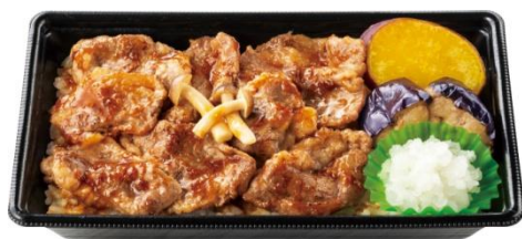
～ブラックアンガスビーフ～ 牛カルビ重 (きのこ香る にんにく醤油ソース) 790 円

付け合わせで、茄子とサツマイモの素揚げを添えており、季節の野菜も味わえる設計になっております。