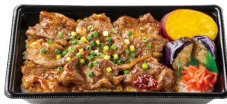
～ブラックアンガスビーフ～ 牛カルビ重 (特製甘辛焼肉ダレ) 790 円