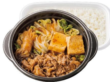
鍋タイプ 牛すき焼き弁当