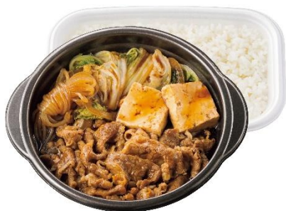
鍋タイプ W 牛すき焼き弁当(肉 2 倍)