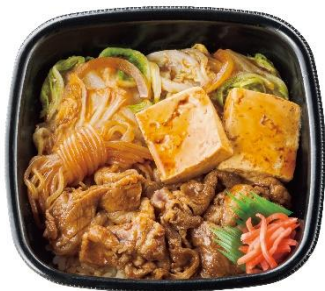
丼タイプ 牛すき重

さらに、ごはんの上にすき焼きを盛りつけた『牛すき重』が今年も登場します。甘辛く煮込んだ肉や野菜とごはんとの相性は抜群です。また、別添の牛すき重専用の追いだれで好みの味付けにアレンジできるのも美味しさのポイントです。