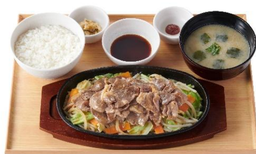
野菜とラムのジンギスカン定食(ラム肉 1.5 倍) 1,590 円