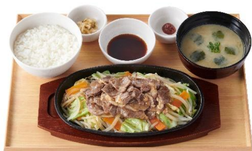
野菜とラムのジンギスカン定食 1,190 円

「やよい軒」の肉料理にラム肉を使用したジンギスカンが新登場します。低脂肪でクセが少なく程よい柔らかさのラム肉を、より美味しくお召し上がりいただくために、醤油ベースに香辛野菜とスパイスとリンゴ果汁などをブレンドした特製のたれを、調理時の味付けと、食べる時のつけだれに使用しました。また、1/2 日分の野菜量のキャベツ、人参、玉ねぎ、もやしの 4 種とラム肉と一緒に摂ることができる、ヘルシーでバランスの良い商品です。※1 ラム肉をもっと贅沢に楽しみたい方向けに、ラム肉 1.5 倍の“野菜とラムのジンギスカン定食”もご用意しました。専門店であらうことしかできないジンギスカンを、「やよい軒」で気軽にお楽しみください。