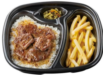
ポテト&ハーフ・カットステーキコンボ

人気の『カットステーキ重』や、肉 1.5 倍の『肉増しカットステーキ重(肉 1.5 倍)』は、肉を増量した仕立てにリニューアル。また、人気のおかずを盛り込み、さらにごはんの上にカットステーキを盛り付けた、贅沢メニューの「スペシャル洋風バラエティ弁当」も発売中です。