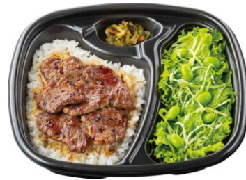
サラダ&ハーフ・カットステーキコンボ