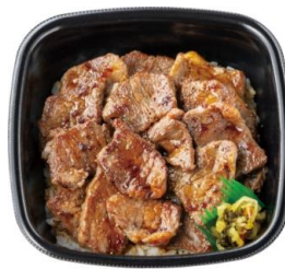
肉増しカットステーキ重(肉 1.5 倍)