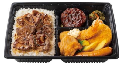
スペシャル洋風バラエティ弁当