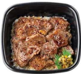
カットステーキ重