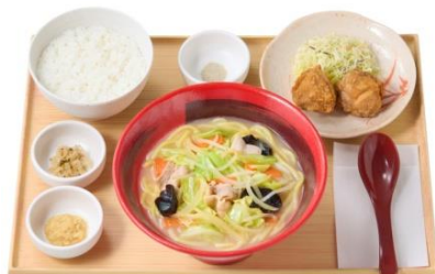
野菜タンメンとから揚げの定食 1,060 円

さらに、別添えの“国産おろし生姜”や“オリジナルスパイス”を加えることで、お好みの味にカスタマイズして、飽きずに楽しんでいただける商品となっております。