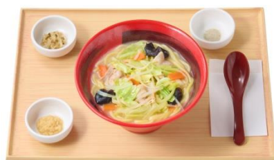
野菜タンメン (単品) 750 円