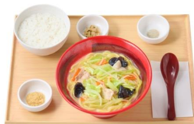
野菜タンメン (ごはん付) 820 円