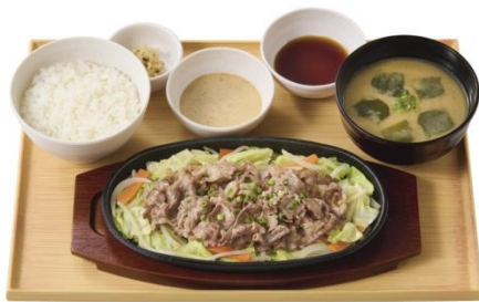
牛焼きしゃぶとたっぷり野菜の定食 (ごまだれ/ぽん酢) 1,000 円

牛肉の美味しさを楽しみながらたっぷり野菜も摂れる、バランスのとれた『牛焼きしゃぶとたっぷり野菜の定食』をご堪能ください。