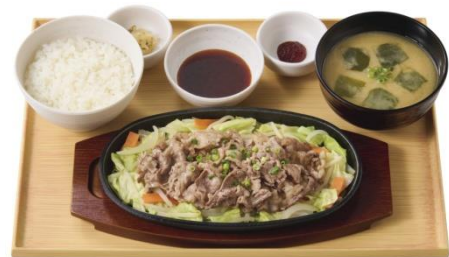
牛焼きしゃぶとたっぷり野菜の定食 (焼肉のたれ/辛子味噌) 1,000 円