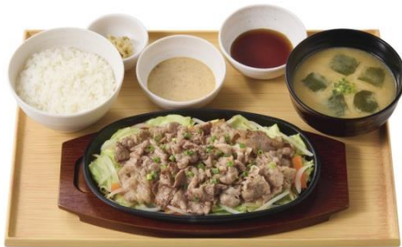
【お肉 1.5 倍】 牛焼きしゃぶとたっぷり野菜の定食 (ごまだれ/ぽん酢) 1,290 円