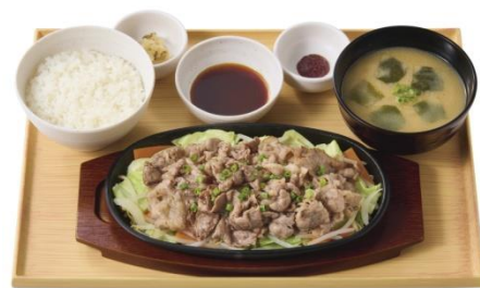
【お肉 1.5 倍】 牛焼きしゃぶとたっぷり野菜の定食 (焼肉のたれ/辛子味噌) 1,290 円