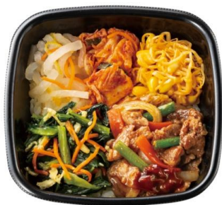
1/2 日分の野菜が摂れる！ 焼肉ビビンバ 590 円

付属のコチュジャンのタレで辛さを調節することができるので、好みの辛さでお召し上がりいただけます。さらに、肉 3 倍の「肉増し焼肉ビビンバ(肉 3 倍)」や、温玉付きなどをお好みに応じて選択することができます。