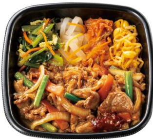
1/2 日分の野菜が摂れる！ 肉増し焼肉ビビンバ(肉 3 倍) 890 円