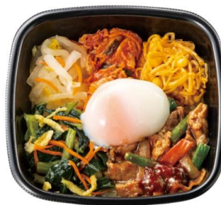
1/2 日分の野菜が摂れる！ 温玉付き焼肉ビビンバ 670 円