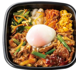
1/2 日分の野菜が摂れる！ 温玉付き肉増し焼肉ビビンバ(肉 3 倍) 970 円