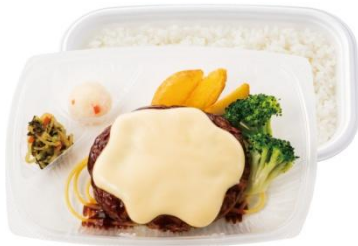
3種チーズでとろーり濃厚 チーズハンバーグ弁当 730 円