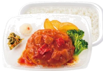
ラタトゥイユ仕立て ごろっと野菜の トマトソースハンバーグ弁当 730 円