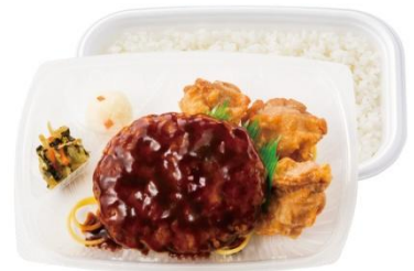
よくばりコンビ デミグラスハンバーグ & から揚げ弁当 850 円