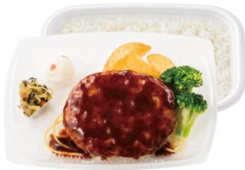
牛すじと野菜をじっくり煮込んだデミソース デミグラスハンバーグ弁当 650 円