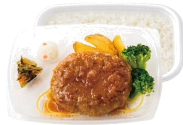
たっぷり玉ねぎでさっぱり 和風オニオンソースハンバーグ弁当 650 円