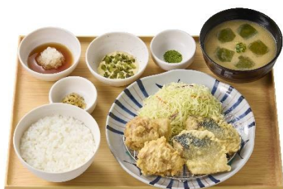
鶏とサバの天ぷら定食 (とり天2個・サバ天2個) 1,090円