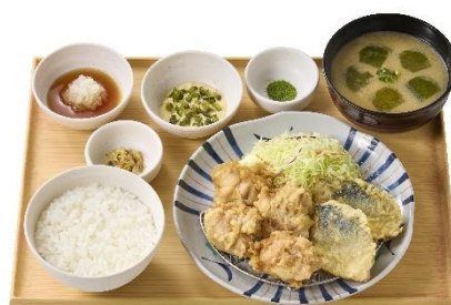
鶏とサバの天ぷら定食 (とり天4個・サバ天2個) 1,390円