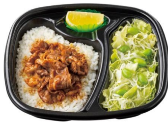
セットでうれしい！ サラダ&ビーフレモンコンボ 630円