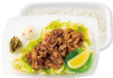
～キャベツたっぷり～ ビーフレモン弁当 630円