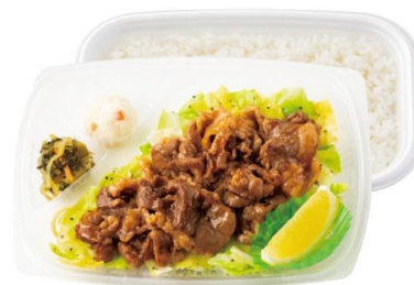
～キャベツたっぷり～ Wビーフレモン弁当(肉2倍) 960円