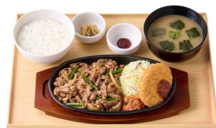
【お肉 1.5 倍】牛カルビ焼肉とコロッケの定食 1,420 円