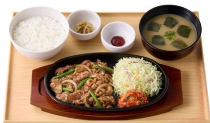
牛カルビ焼肉定食 970 円