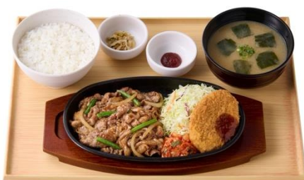
牛カルビ焼肉とコロッケの定食 1,120 円