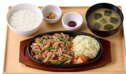
【お肉 1.5 倍】牛カルビ焼肉定食 1,270 円