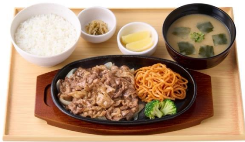
レモンビーフ定食 990 円