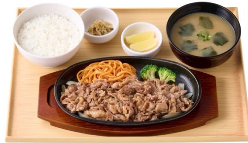
【お肉 1.5 倍】レモンビーフ定食 1,290 円