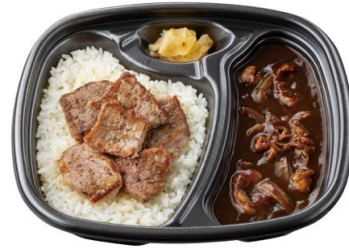
牛肉と玉ねぎの旨み 牛肉黒カレー(ハーフ・カットステーキ) 900 円