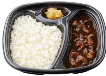
牛肉と玉ねぎの旨味 牛肉黒カレー 600 円