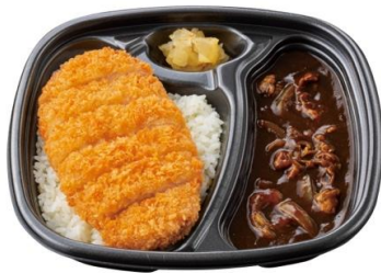
牛肉と玉ねぎの旨味 牛肉黒カレー(ロースカツ) 780 円