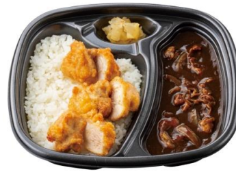
牛肉と玉ねぎの旨味 牛肉黒カレー(から揚げ) 740 円