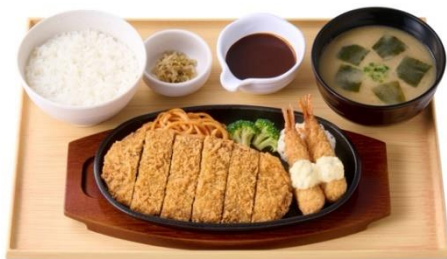
ビフカツとエビフライの定食 1,520 円