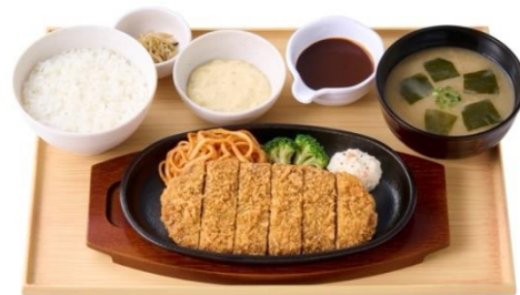
タルタルビフカツ定食 1,280 円