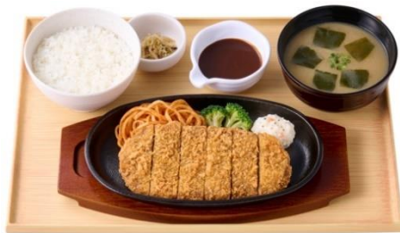
ビフカツ定食 1,230 円