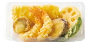
エビ2尾/イカ/ホタテ/野菜3種 天ぷら盛り合わせ 520円