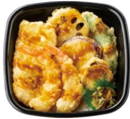
エビ2尾/イカ/ホタテ/野菜3種 海鮮天丼 620円