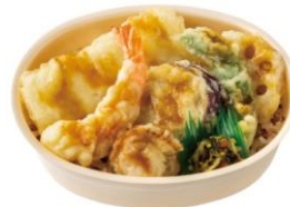
～もち麦ごはんのミニ弁当～ もちミニ 海鮮天丼 560円