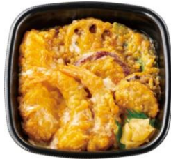
エビ2尾/イカ/ホタテ/野菜3種 海鮮天とじ丼 680円