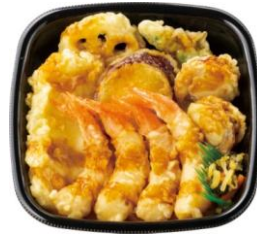
エビ4尾/イカ/ホタテ2コ/野菜3種 上・海鮮天丼 780円