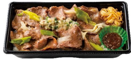
こだわりのうまさ Wネギ塩牛タン弁当(肉2倍) 1,600円