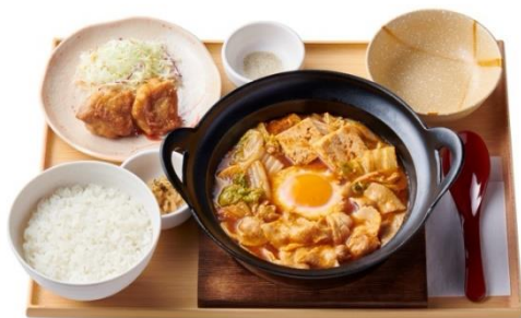
チゲとから揚げの定食 1,020 円