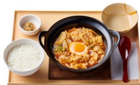
チゲ定食 900 円