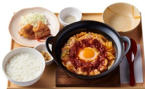
辛旨チゲとから揚げの定食 1,090 円