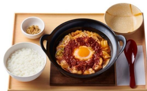
辛旨チゲ定食 970 円