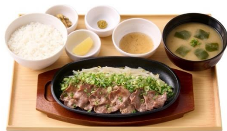
ネギたっぷり牛タン定食 1,390 円