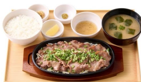
【お肉2倍】ネギたっぷり牛タン定食 1,990 円