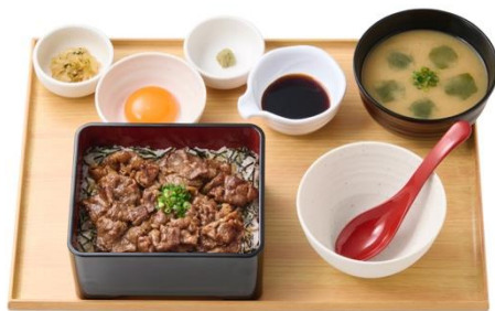
黒毛和牛まぶし定食 1,490 円