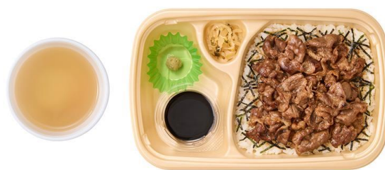
[テイクアウト] 黒毛和牛まぶし だし付 1,430 円