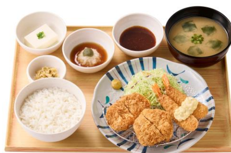
三元豚のヒレかつとエビフライの定食 1,170 円