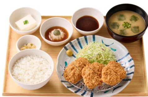
三元豚のヒレかつ定食 1,070 円