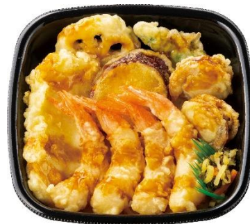
エビ4尾/イカ/ホタテ2コ/野菜3種 上・海鮮天井 790円