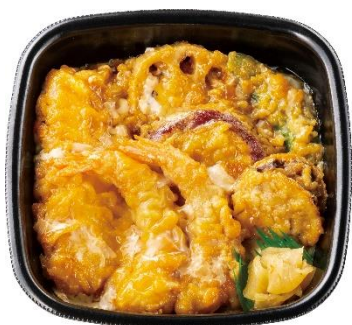
エビ2尾/イカ/ホタテ/野菜3種 海鮮天とじ丼 690円