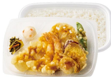
エビ2尾/イカ/ホタテ/野菜3種 海鮮天ぶら弁当 690円