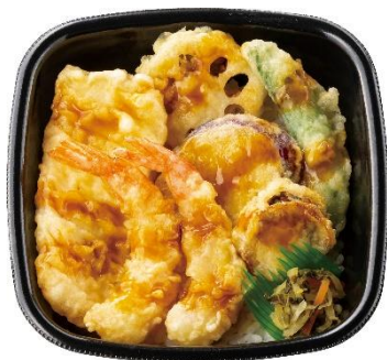
エビ2尾/イカ/ホタテ/野菜3種 海鮮天井 640円