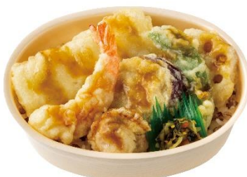
～もち麦ごはんのミニ弁当～ もちミニ 海鮮天井 580円