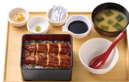
上うなぎまぶし定食 2,090 円