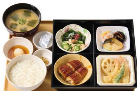
うなぎ御膳 1,690 円