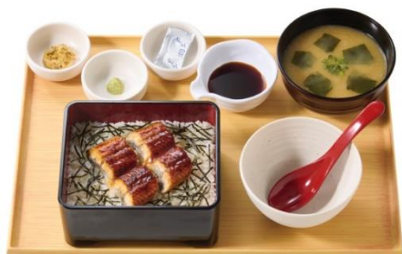
うなぎまぶし定食 1,290 円

また、ご家庭でも様々な味わいでうなぎを楽しめるよう薬味やだしを添えた『[テイクアウト]うなぎまぶし だし付』と『[テイクアウト]上うなぎまぶし だし付』で、ひつまぶし風アレンジをそのままご家庭でもお楽しみください。