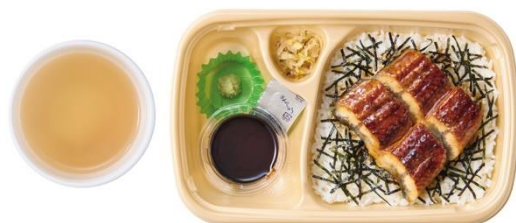
[テイクアウト]うなぎまぶし だし付 1,290 円