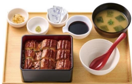
特上うなぎまぶし定食 2,890 円