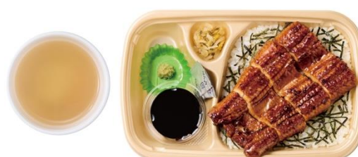
[テイクアウト]上うなぎまぶし だし付 2,090 円