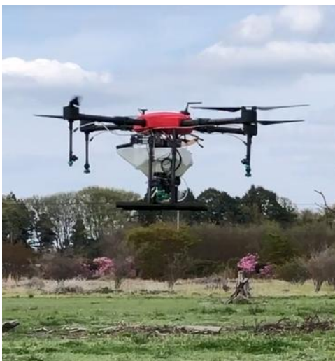
ドローンイメージ

プレナスでは、これからもお客様の満足と健康を実現し、人びとに笑顔と感動をお届けし続けることができるよう邁進してまいります。