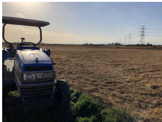
田んぼの様子 (21年2月)