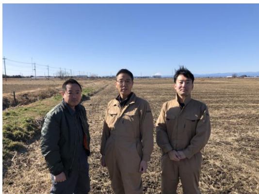
加須ファームメンバー