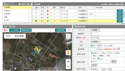
クラウド型水管理システムや見える化の取り組み