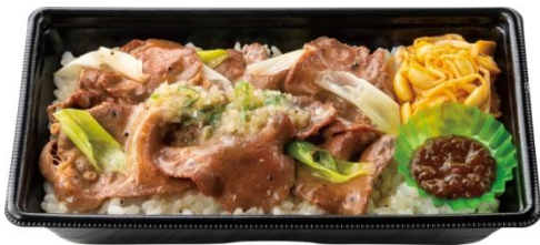
ネギ塩牛タン弁当 900 円

ネギ塩牛タンをがっつり味わいたい方には、通常の 2 倍の肉を使用した『W ネギ塩牛タン弁当』もご用意しております。