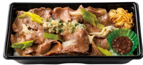
W ネギ塩牛タン弁当(肉 2 倍) 1,500 円